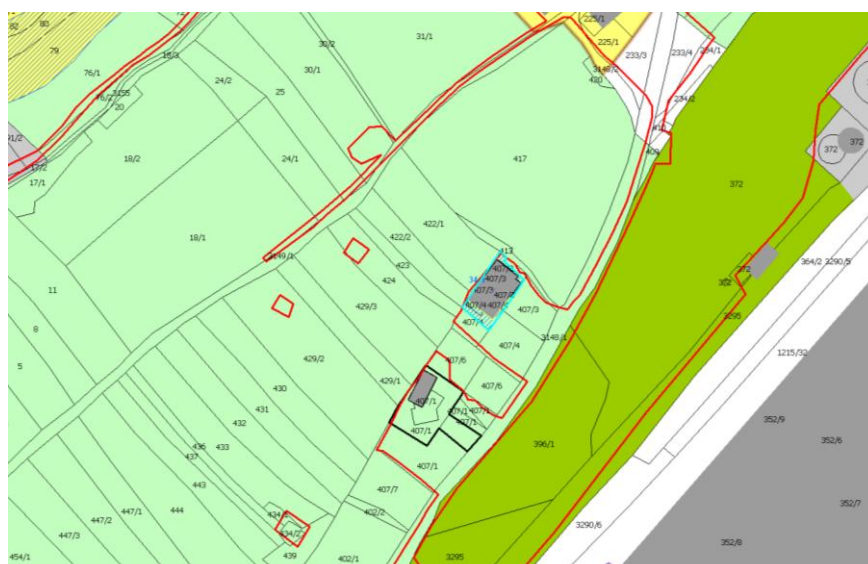
Slika 2: Veljavni plan (Odlok o občinskem prostorskem načrtu Občine Kanal ob Soči, december 2012) s prikazom poselitvenih enot (glej strokovne podlage – tematske analize, karta B) in dejansko rabo