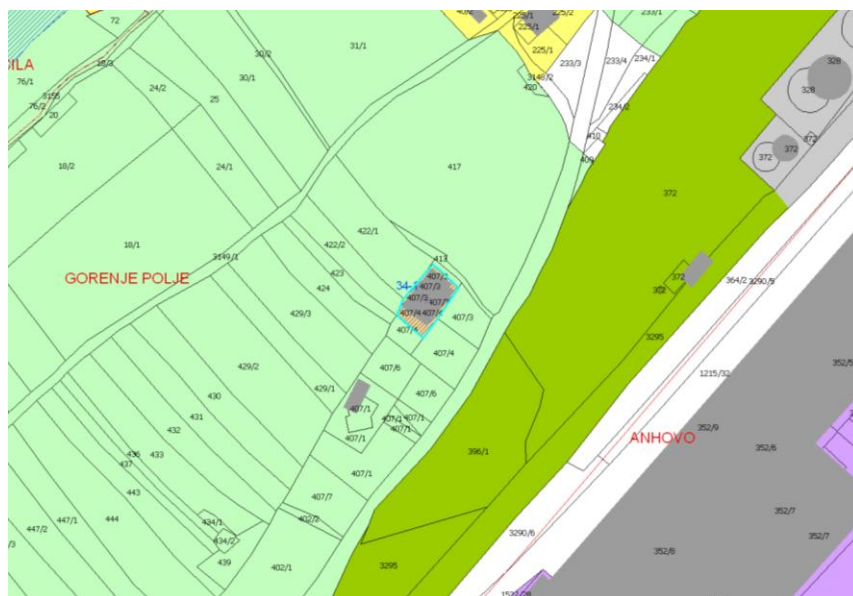
Slika 3: OPN s prikazom opredeljene pobude