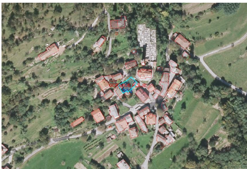
Slika 1: DOF (prikaz stanja) s prikazom prejete pobude