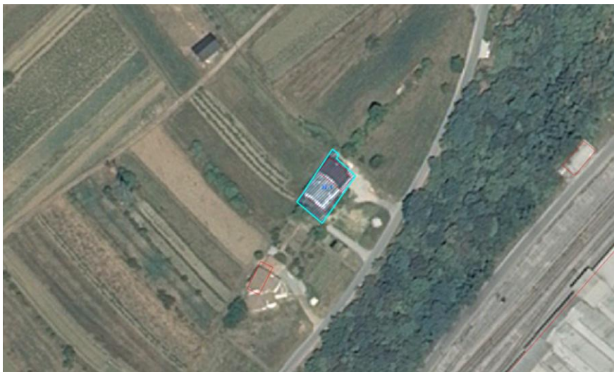
Slika 1: DOF (prikaz stanja) s prikazom prejete pobude